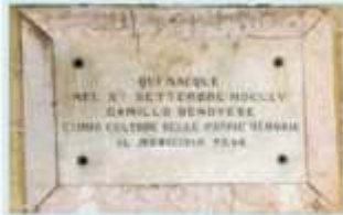
In alto la lapide collocata all'esterno dell'edificio, a destra il ritratto di Camillo Genovese

Redazione: viale della Regione, 6 tel. 0934 554433 caltanesetta@lasicilia.it